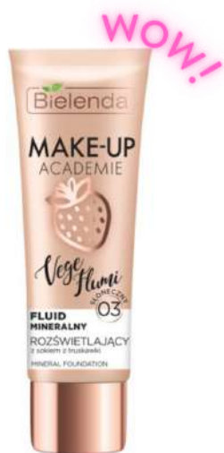
Bielenda Vege Flumi LEKKIE KRYCIE Cena: 15 zł