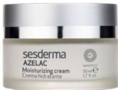
Sesderma Azelac Cena: 124 zł