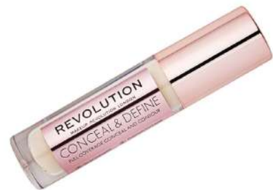
Makeup Revolution Conceal Cena: 27 zł