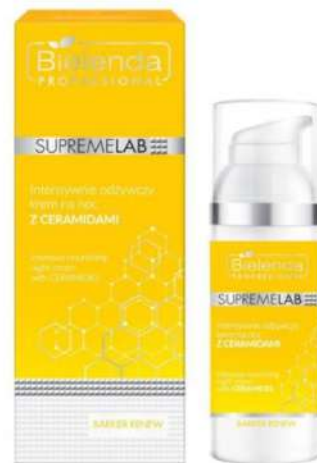
Bielenda Supremelab Cena: 74 zł