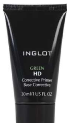
Inglot Green HD KORYGUJĄCA Cena: 54 zł