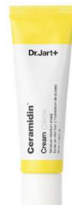
Dr. Jart+ Ceramidin Cena: 165 zł