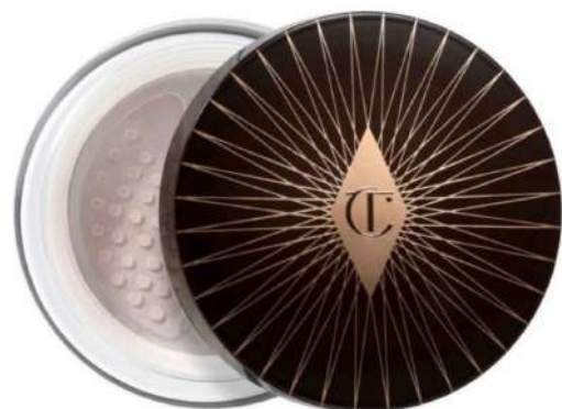
Charlotte Tilbury CHARLOTTE'S GENIUS Cena: 269 zł