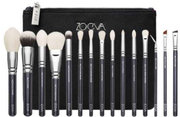
Komplet pędzli Zoeva Cena: 600 zł