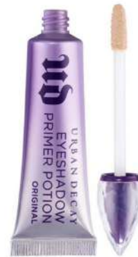
Urban Decay Primer Cena: 115 zł