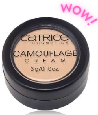
Catrice Camouflage Cena: 13 zł