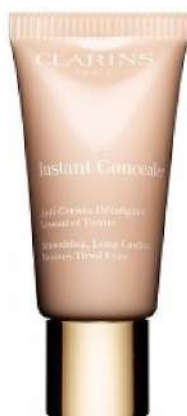
Clarins Instant Cena: 128 zł