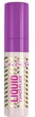
Lovly Cena: 15 zł