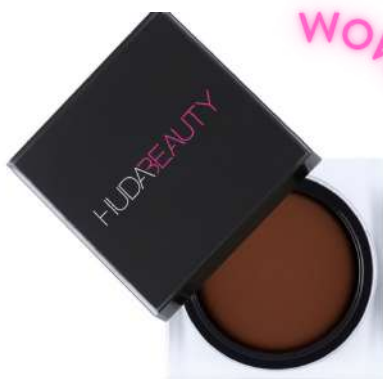
Huda Beauty Bronze Cream