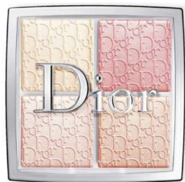
Dior Backstage Cena: 229 zł