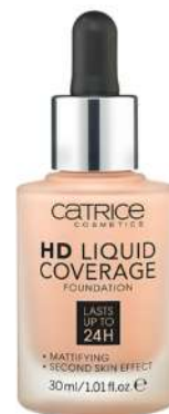
Catrice HD MOCNE KRYCIE