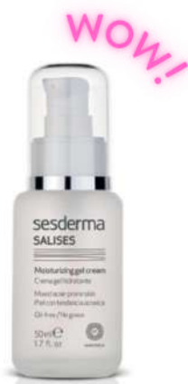
Sesderma salises Cena około 96 zł