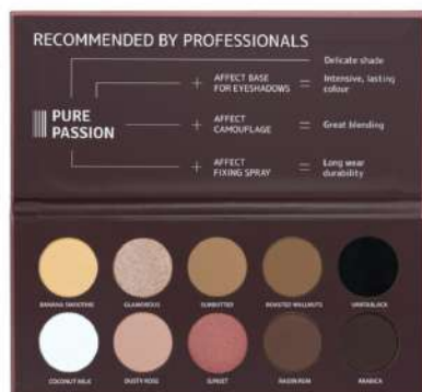
Affect Pure Passion