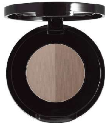
Cien do brwi Anastasia