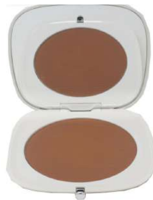
Marck Jacobs bronzer