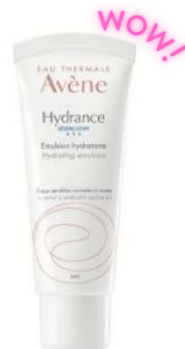
Avene Hydrance Cena: 79 zł