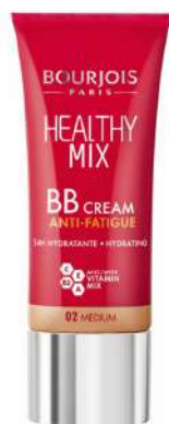
Bourjois Healthy Mix LEKKIE KRYCIE