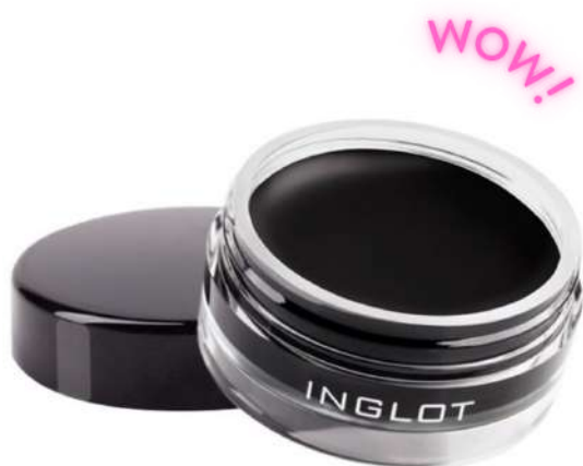
Inglot konturówka 77