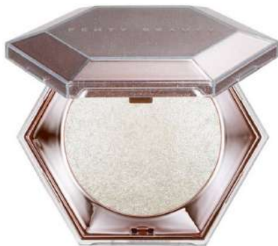
Fenty Beauty Cena: 179 zł