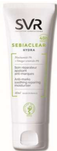
SVR Sebiaclear Cena: 39 zł