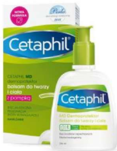
Cetaphil Dermoprotektor Cena: 45 zł