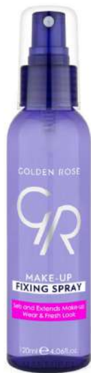
Golden Rose Utrwalacz Cena: 15 zł