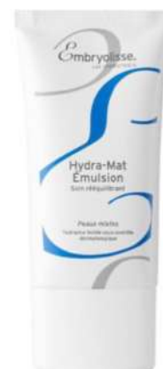
Embryolisse Hydra Mat Cena około 99 zł