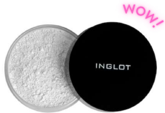
Inglot 3S Cena: 49 zł