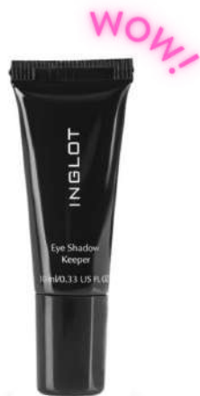
Inglot Eye Shadow Keeper Cena: 55 zł