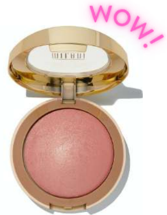
Róż Miliani Cena: 53 zł