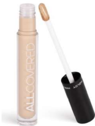
Inglot All Covered Cena: 57 zł