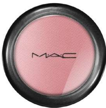
Róż Mac Cena: 124 zł