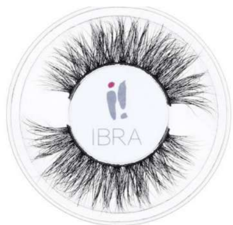
Rzęsy na pasku IBRA