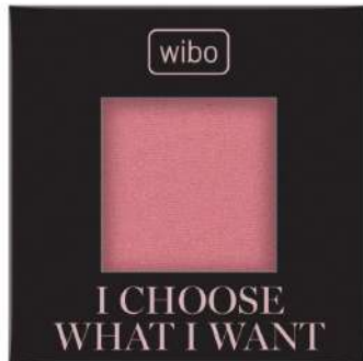
Róż Wibo Cena: 14 zł