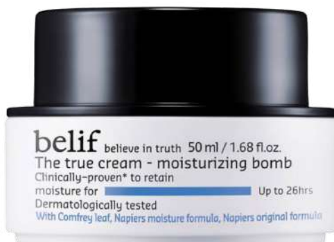
Belif The true cream Cena: 149 zł