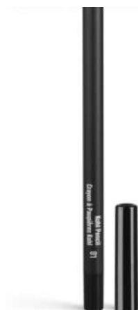
Inglot Kredka Kohl