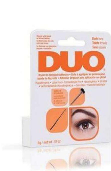
Klej Duo Czarny Cena: 23 zł

Z produktami poniżej aplikacja sztucznych rzęs będzie zdecydowanie łatwiejsza.