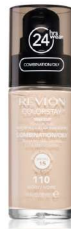
Revlon Colorstay MOCNE KRYCIE Cena: 22 zł