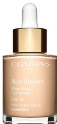
Clarins Skin Illusion LEKKI KRYCIE Cena: 189 zł