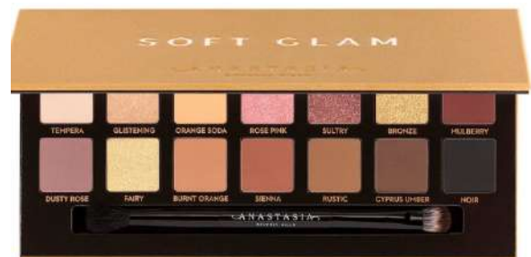
Anastasia Soft Glam