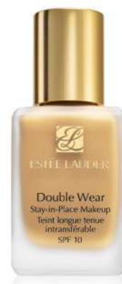
Estee Lauder Double Wear MOCNE KRYCIE Cena: 195 zł