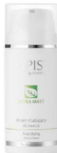
Apis Ultra Matt Cena: 60 zł