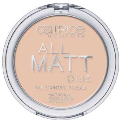
Catrice All Matt Cena: 15 zł