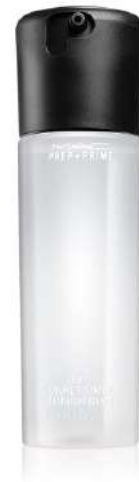
Mac Primer Cena: 98 zł