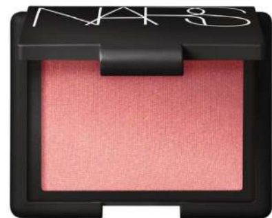
Róż Nars Orgasm Cena: 169 zł