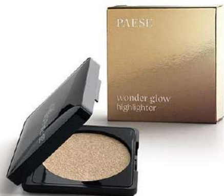
Paese Cena: 45 zł