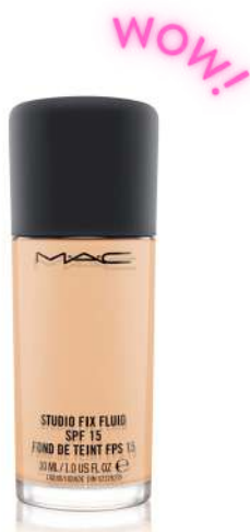
Mac Studio Fix MOCNE KRYCIE