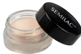
Semilac Cena: 45 zł