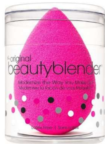
Gąbeczka Beauty Blender Cena: 70 zł