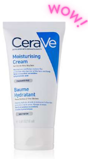
CeraVe Krem nawilżający Cena: 38 zł