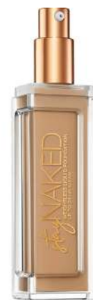
Urban Decay Stay Naked ŚREDNIE KRYCIE