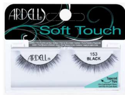
Rzęsy na pasku Ardell