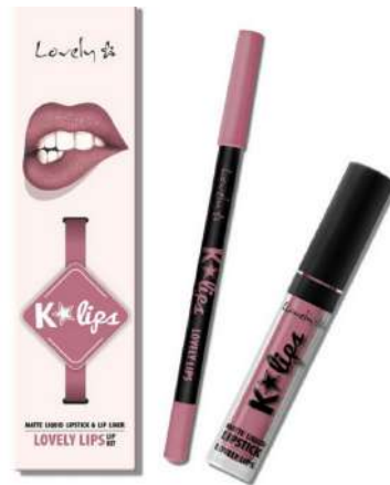
Pomadka matowa Lovely Cena: 26 zł