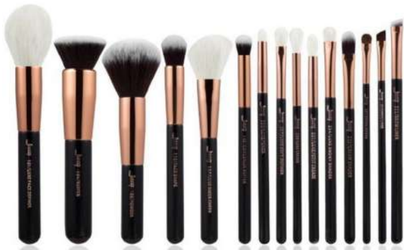
Komplet pędzli Jessup Cena: 120 zł