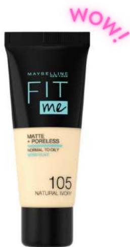
Maybellin Fit Me LEKKIE KRYCIE Cena: 21 zł