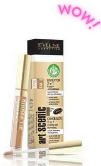
Eveline 2 in 1 Cena: 16 zł