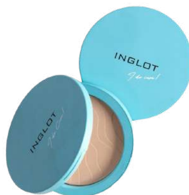
Inglot Stay Hydrated