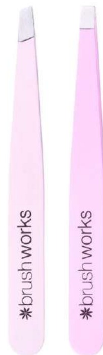
Pęseta płaska Cena: 25 zł