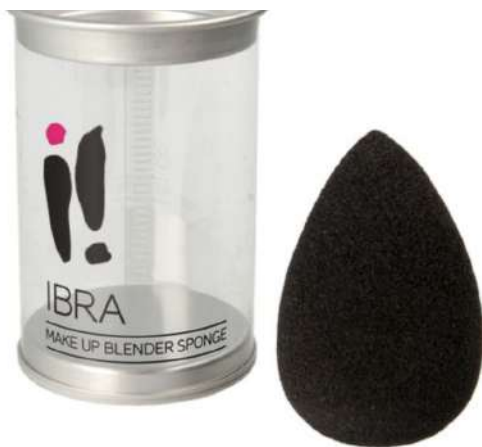
Gąbeczka IBRA Cena: 15 zł