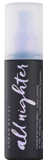
Urban Decay All Nighter Cena: 165 zł