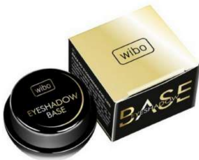
Wibo Base Cena: 12 zł

Trwały makijaż oczu i idealnie wyblendowane cienie zdecydowanie zasługa odpowiednio przygotowanej wcześniej powieki. Poniżej kilka topowych produktów, które sprawiają, że cienie na powiece utrzymują się dłużej, nie rolują się. Blendowanie cieni będzie dzięki tym produktom zdecydowanie łatwiejsze.