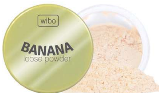
Wibo Banana Loose