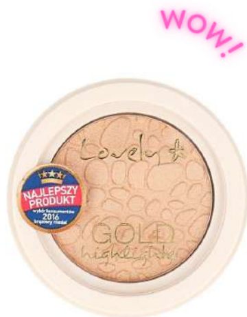
Lovely Gold Cena: 12 zł