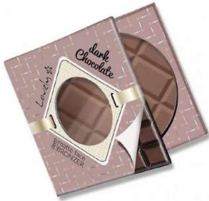
Lovely Dark Chocolate

POZNAJ PRODUKTY, DZIĘKI KTÓRYM WYMODELUJESZ OPTYCZNIE TWARZ