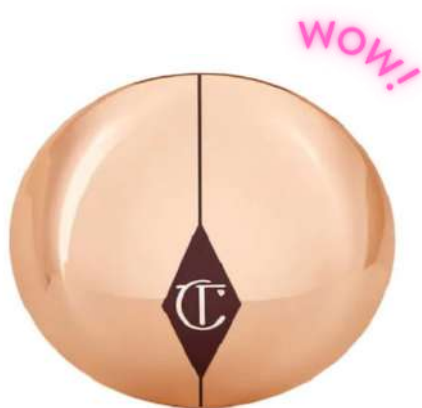
CHARLOTTE TILBURY AIRBRUSH FLAWLESS