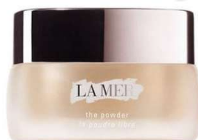
LA MER SkincolorThe Powder