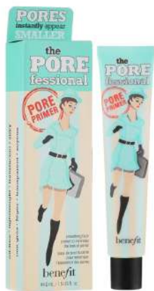
Benefit The Pore MATUJĄCA Cena: 48 zł