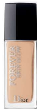
Dior Skin Glow ŚREDNIE KRYCIE Cena około 235 zł