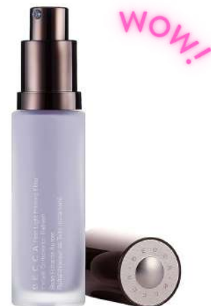
Becca First Light DO SKÓRY DOJRZAŁEJ Cena: 159 zł