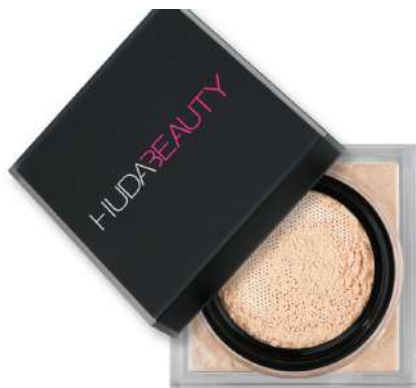
Huda Beauty Matt Power Cena: 185 zł