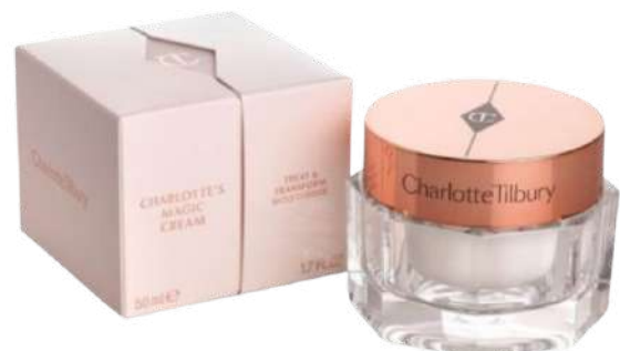
Charlotte Tilbury Magic Cream Cena: 389 zł