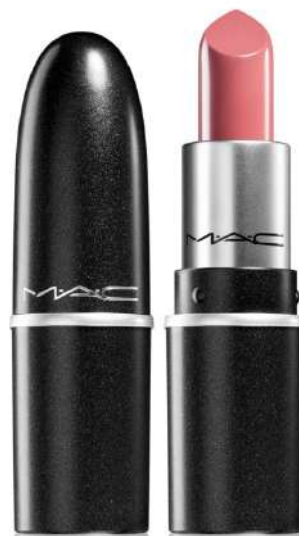
Pomadka satynowa Mac Cena: 89 zł