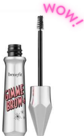
Benefit żel do brwi